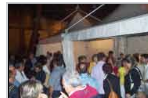
Degustazione di prodotti locali nella notte bianca