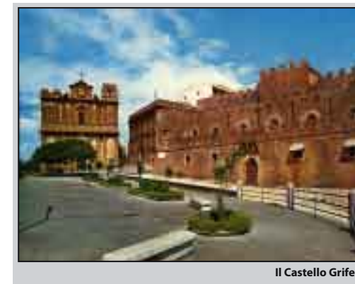
Il Castello Grifeo

Più tardi, nel 1910, la strada avrà i marciapiedi e i canali smaltitoi (fognatura per acqua piovana) e la sede stradale sarà imbroccata, cioè ricoperta da uno strato di sabbia mista a breccia (“lu bracciali”, costituito da sassi ricavati dalla frantumazione di blocchi di pietra dura a colpi di martello da parte di “li braccialara”); il tutto pressato con un rullo di pietra tirato da cavalli o con un cilindro a vapore. In tale circostanza per la prima volta a Partanna viene usato il cilindro a vapore, approntato dal cav. Giuseppe Adragna.