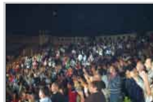
Il numeroso pubblico

Infine a chiusura delle attività, anche fuori della Festa d'estate, l'edizione di quest'anno di "Moda in città".