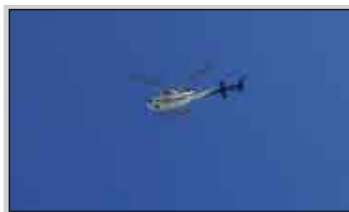
Due giorni di giri in elicottero (a 70 euro ogni dieci minuti)

continuati i lavori fra cui quelli di ripulitura della spiaggia che si sono protratti per troppo tempo a danno delle narici dei vil-