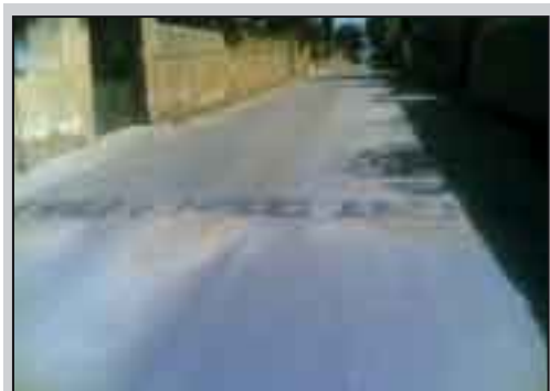
Rallentatori, in contrada Montagna, i quali a causa dei pezzi mancanti rischiano di essere più pericolosi che se non ci fossero