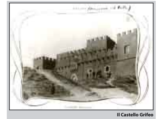
Il Castello Grifeo