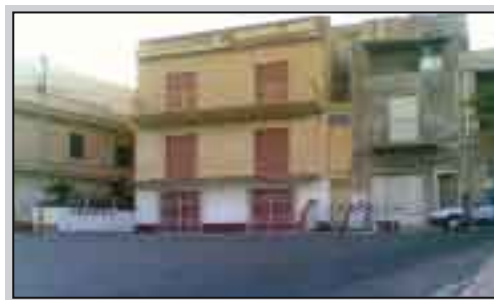
La scomparsa di un bar storico

leggianti. I giovani, secondo una tendenza iniziata negli anni scorsi, hanno continuato a prendere la strada per Triscina e