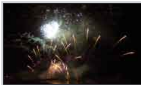
Le gare pirotecniche, fra le manifestazioni più di richiamo

pensare a Selinunte come ad un centro turistico per adulti, (cosa che astrattamente non si deve considerare di per sé