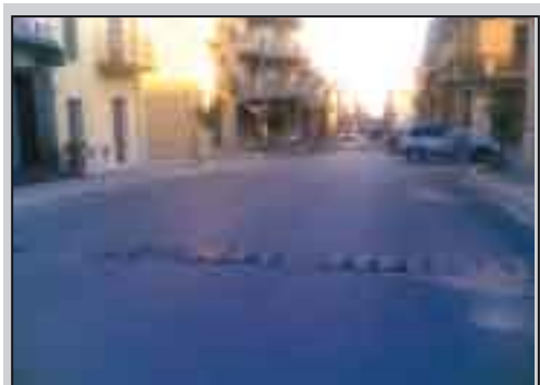
Altra parte della città con lo stesso problema.