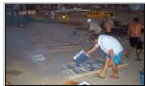
La sagra della sarda