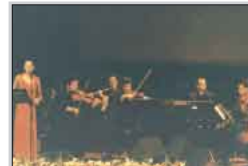
L'Ensemble Selinus al Teatro Pirandello di Agrigento

A Torretta Granitola, antico borgo di pescatori che si dispiega su una delle insenature più suggestive e magiche della costa mediterranea, una voce angelica, baciata dalla luna, attende il sospiro degli archi per effondersi nell'etere. Il suo dolore, sospeso sul vento leggero di ponente, coinvolge i villeggianti e le luci rivierasche. Ombre misteriose scivolano sulle onde per guadagnare lo scoglio e placare le inquietudini sulle ali delle dolci note. E' la musica magica del gruppo Ensemble Selinus che si esibisce nell'agosto del 2007, in occasione del XII Premio Nazionale di Poesia Tre Fontane - Cave di Cusa. E' una musica che fa sognare, inebria i sensi e in un rapimento mistico conduce oltre il tempo e lo spazio. Arcane voci del Mediterraneo s'incontrano, fluttuano; antico e moderno s'intrecciano in un richiamo a confine tra l'essere e il nulla. L'Ensemble Selinus nasce come quartetto d'archi nel 1995 e inizia subito un periodo di studio e ricerca musicale rivolto alle colonne sonore di film e alla loro divulgazione tramite concerti. Nel 2001 viene fondata l'Associazione Musicale Amarcord, cui l'Ensemble Selinus afferisce per la parte burocratica e amministrativa. Nello stesso anno