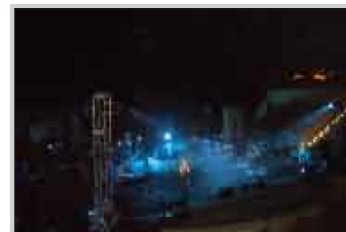
La cantante Fiorella Mannoia al teatro provinciale