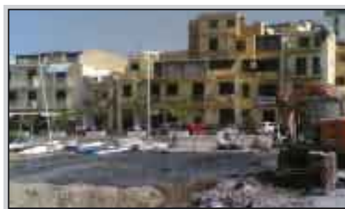
"Che estate di melma"

dei giochi pirotecnici), questo - formato oltre che da adulti anche di giovani - si è puntualmente presentato. Ma se si vuole