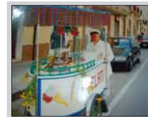
Don Totò.