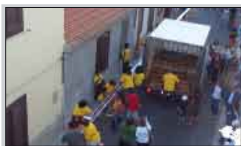
Un momento della giornata del pani cunzatu che si tiene oggi (la foto si riverisce all'edizione del 2007)

Tre Fontane. Tutto negativo, allora? Quando si sono fatte iniziative in grado di coinvolgere un pubblico vasto (come le gare