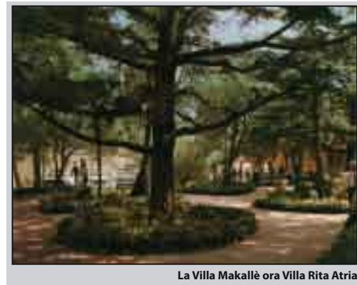
La Villa Makallè ora Villa Rita Atria

quelle del Collegio o della chiesa di S. Nicolò). Tali livellamenti richiedono ingenti somme. Basti pensare che talvolta i tagli sono talmente forti da provocare seri danni alle