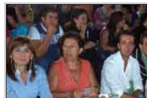
A destra nella foto, il sindaco di Gibellina, Vito Bonanno.