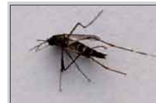
Una delle zanzare tigre "catturate" a Partanna.

si possa raccogliere acqua. Eliminare qualsiasi ristagno d'acqua nelle aree verdi, nei cortili, sui balconi, sui terrazzi, nelle caditoie del tetto e nei tombini.